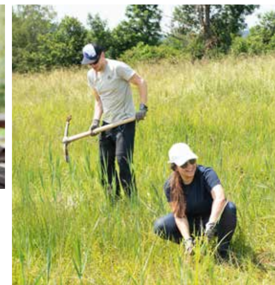
Gruppenführung (oben) Mieten für stimmungsvolle Anlässe (links) Corporate Volunteering (rechts)